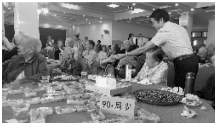
钱塘新区中沙社区邀请百多位老人参加重阳节活动。

过,老两口说,他们可以照顾自己,不去麻烦子女,生活自由自在。说起长寿的秘诀,两位老人说,现在生活条件好,每天开开心心的比什么都重要。