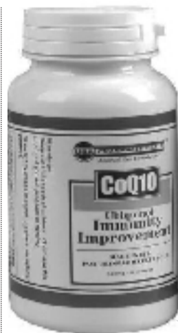
本品不能替代药品

“这款辅酶Q10,性价比特别高,我经常给老爸买,他吃着挺好,前段时间一直断货,去网上搜价格已经涨了几十块钱,也不知道真假,没敢买!昨天健康顾问通知我老款到货了,我第一时间订购了一组,不仅没涨价,前100名订购还加送一瓶,真的太划算了。”