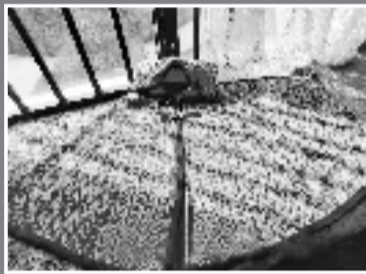
最得意的编织作品——紫色斗篷。