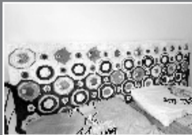
女儿的小床,用精巧的编织装点起来。