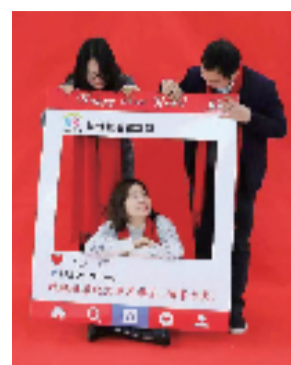
2019年,杭铁社区秀的是朋友圈拜年照