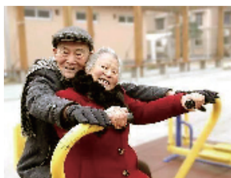
2018年,杭铁社区秀的是老人们《幸福的模样》