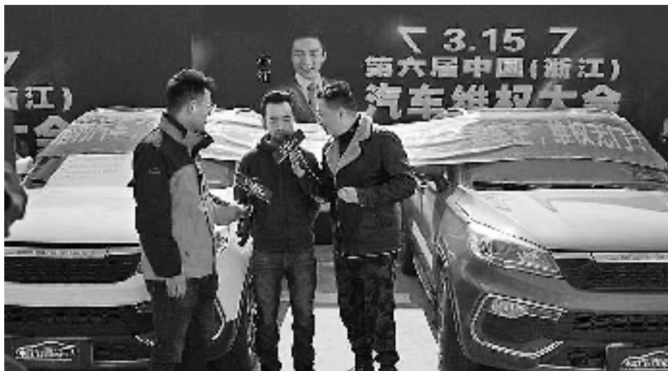
2019年3月15日,第六届中国(浙江)汽车维权大会现场。(资料图片)

本届汽车维权大会将首次采用线上直播方式进行,并提前开通投诉热线:0571-85310139、85311556,欢迎拨打。