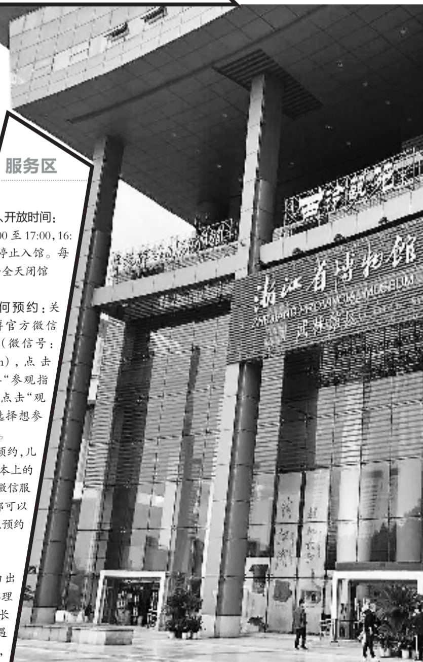
武林馆区开放首日