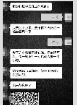
网络交友对象开始套人投资