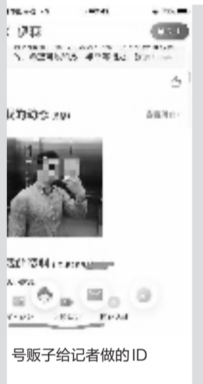
号贩子给记者做的ID

但多数平台至今仍不强制要求用户进行实名验证。一名婚恋网站客服回复记者,“注册用户没有实名认证,只会对交友的关注度产生影响。”但刚刚完成注册的记者,还是立刻就收到了异性消息。