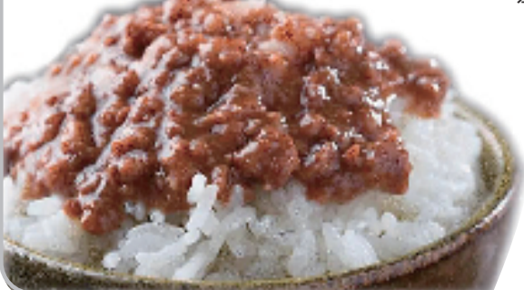
一茶一坐的肉燥饭