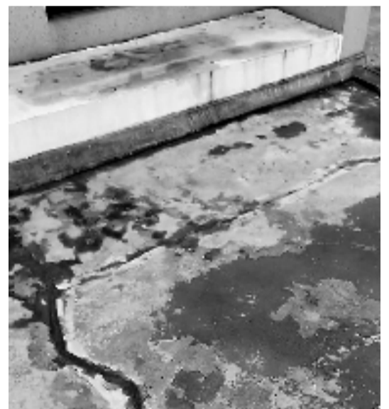
楼顶的裂缝触目惊心