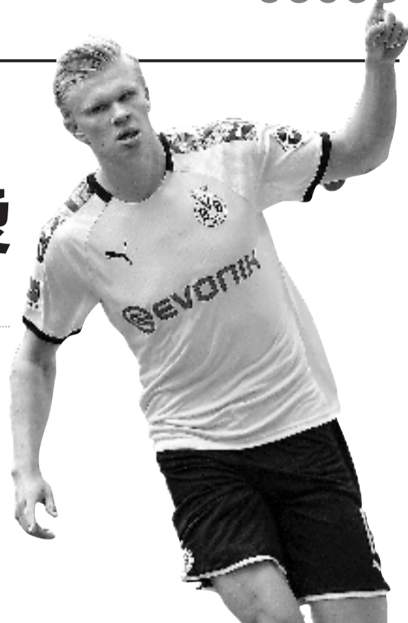
身价1亿欧元的挪威国脚哈兰德。

在联赛和欧冠停摆前,多特在欧冠八分之一决赛中不敌巴黎圣日耳曼,最终止步十六强,球队的全部精力都放到了对联赛冠军的争夺上。虽然在赛季前半段,多特战绩飘忽不定,但在冬窗期引援后,球队表现越来越稳定。特别是19岁小将哈兰德的加盟,让球队有了质的提升,哈兰德加盟球队后在12场比赛中打入了13球,同时他出战的9场德甲中也打入了10粒进球。