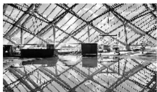
钢结构骨架

昨天,杭州市钱江新城管委会(市奥体博览城指挥部)发布消息,作为亚运重要场馆之一的杭州奥体博览城体育游泳馆,已全面完成土建结构和钢结构封顶,机电完成75%,幕墙完成60%,屋面完成80%,精装完成30%。预计整个场馆将于2020年12月完工。