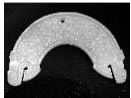
战国青玉双龙首璜·河南博物院