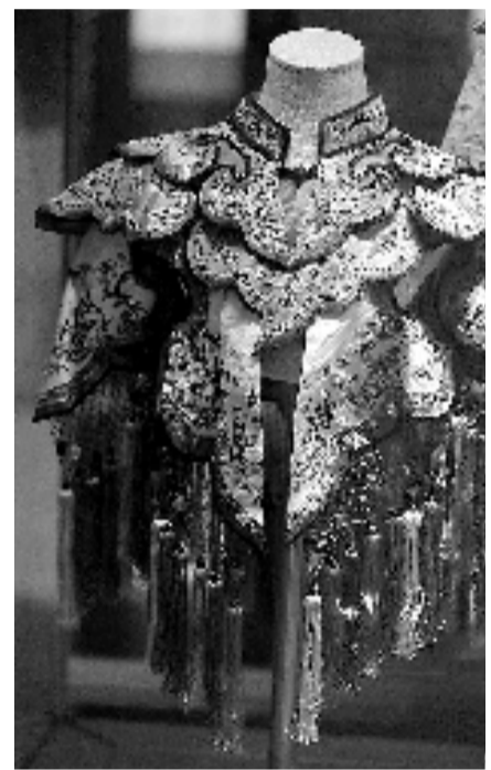
清代彩地庭院仕女图云肩·中国扇博物馆

再比如他发了一组逛西湖时的风景美图,随即有湖北网友留言:湖北人去杭州有啥要求吗?“动脉影”现身说法——“下了火车找工作人员指点要去哪,随后会被带到指定地方隔离,做核酸和血清两种检测,24小时之内出结果,结果一出红码就转绿码。”