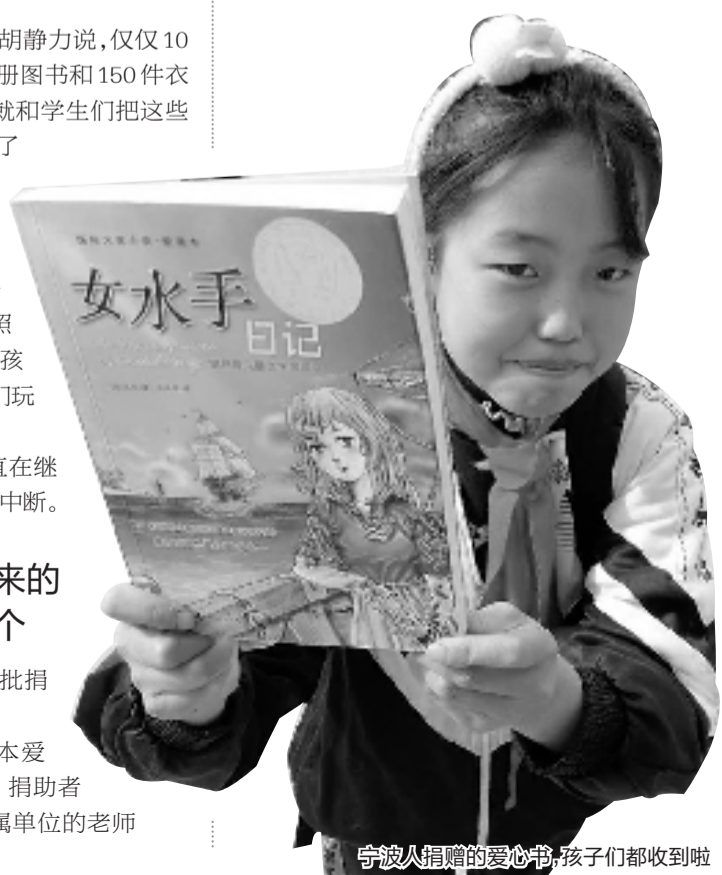
宁波人捐赠的爱心书,孩子们都收到啦