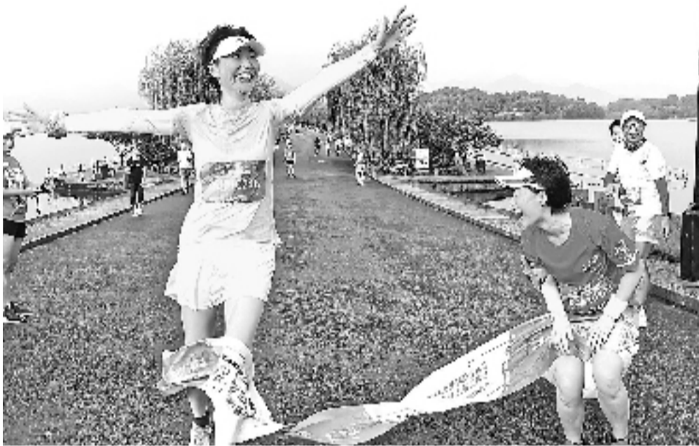
杭州跑友组团参加“浙江马拉松线上赛”的台州站,不光打印了号码簿,还备了冲刺带。

近日,“浙江马拉松线上系列赛”正式启动,在接下来的两个月里,浙江省内将有8场线上马拉松接力登场,让你一次“跑遍浙里”。