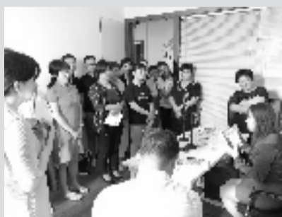
培训课上的模拟练习