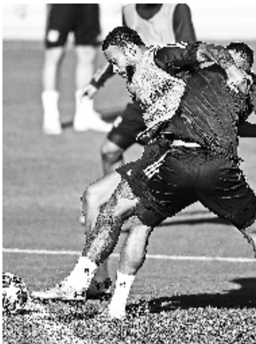
里昂全力备战新赛季。