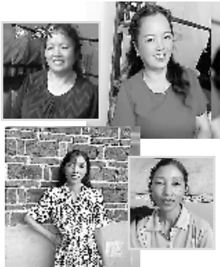
农村留守女性化妆前后对比照(网络视频截图)

阿里巴巴天天正能量平台总监王崇和说,希望“我给妈妈化个妆”活动能成为最温馨的亲情互动场景,让那些羞于对长辈说出“我爱你”的人,通过这样轻松且略带“仪式感”的互动,以另一种方式道出“我爱你”三个字。