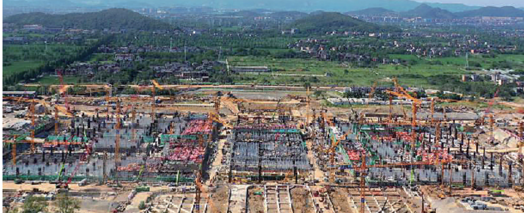
杭州西站站最大基坑封顶