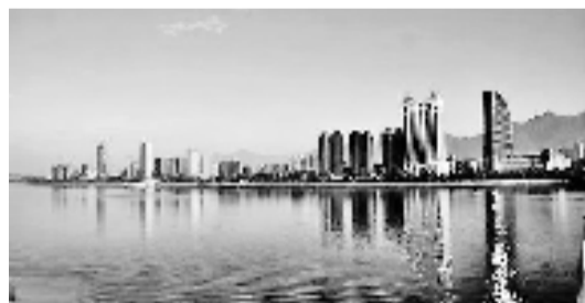
桐庐县康乐三弄商铺

项目地址:桐庐县县城康乐三弄16号 交付时间:现房 户型面积:40.54m 2 销售价格:约37.3万元 物业类型:商铺