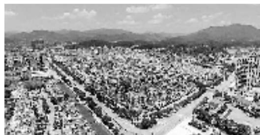
新安江环城北路商铺

项目简介:东临康乐三弄,南临康乐路,西靠体育场路,北临天目路。距离桐庐县中医院约500米,附近有迎春小学公交车站,有桐庐3路、10路等公交车经过。附近有桐庐县实验幼儿园、桐庐县体育中心等公共配套。