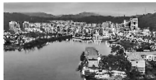
淳安南山大街商铺

项目简介:东临新林路,南临新安路,西临水电巷,北临环城北路。距离新安江150米,附近有罗桐社区、国瑞酒店公交车站,有1路、4路、6路等公交车经过,公共交通便捷。附近有新安江第一小学、中国银行等公共配套。