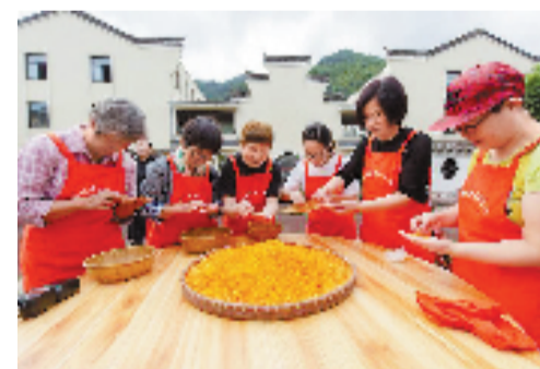
李岙村村民制作糖桂花。