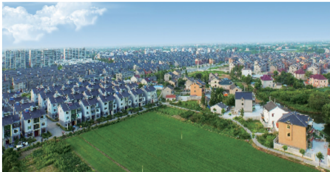
嘉兴南湖区凤桥镇

刚刚过去的国庆中秋长假让不少人舒缓了紧绷的神经,但嘉兴南湖区新时尚研学之窗精品线凤桥段工地上,建设者们却不停歇,工人和工程车辆紧张有序作业,奋力冲刺抢进度,施工现场一片繁忙景象,不打烊的工地上演绎着一幕幕“速度与激情”。南湖区凤桥镇相关负责人介绍:“作为美丽城镇建设重点项目之一,精品线建设注重地域文化传承,融合古典与现代,将让凤桥更具人文魅力。”