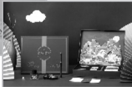
台博文创 《诗阅台州》