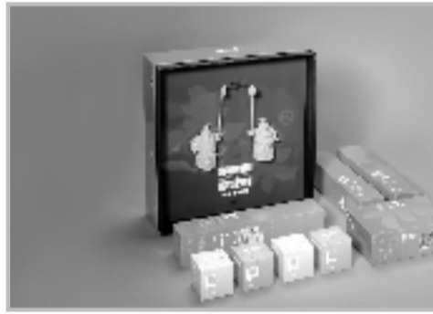
谷雨文创年礼系列