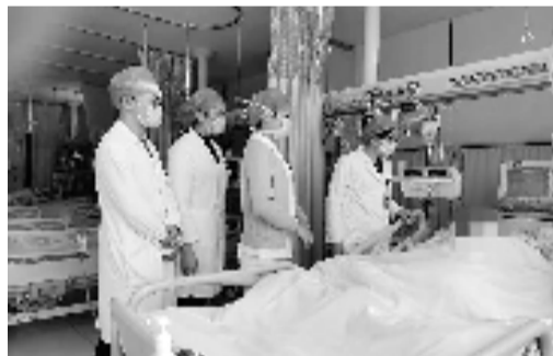
急诊重症监护室医生护士查看患者病情

“之后基本是,半个小时心脏室颤发作一次,我们早有准备,立即用电击除颤将之‘唤醒’,接着又发作,再次被‘唤醒’,周而复始,直至次日凌晨。”参与抢救的医务人员说。