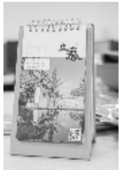
周柚辛丑年 柚见美宿节气台历

我们结合浙报集团智能旅行推荐平台周柚2021年推出的辛丑年柚见美宿节气年历, 在24家浙江精品民宿里优中选优, 罗列了一份藏在“浙里”的最美民宿清单, 还可关注“周柚”微信公众号, 点击“最新活动”, 领取节气台历。拿着这份礼物, 还能享最高5000元的民宿折扣或餐饮福利。