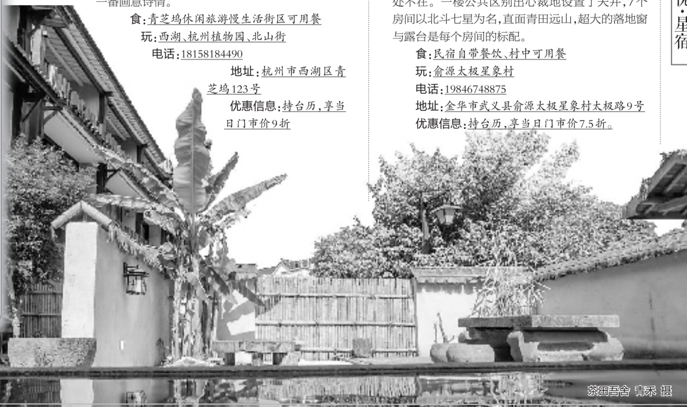
茶田吾舍