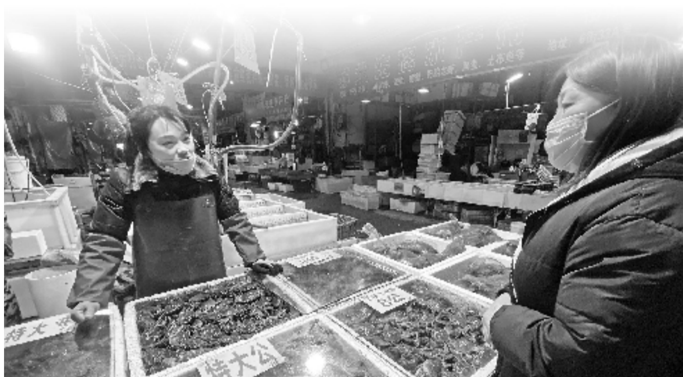
卖湖蟹的老丁儿媳