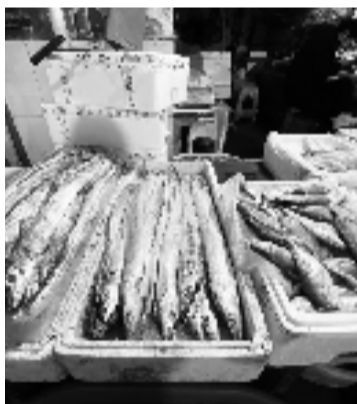
带鱼、小黄鱼等国产冰鲜海鲜

不过淡季的时候,比如7-8月份螃蟹会瘦一些,价格就跌到180-190元/斤,那时来市场,最便宜的话,630元就能买到一只帝王蟹。