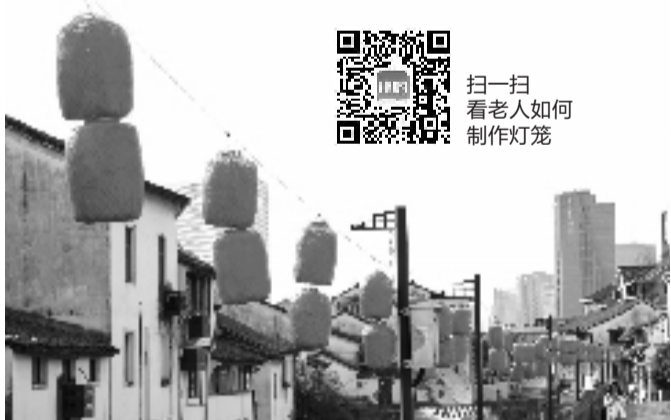
西兴古镇上的灯笼