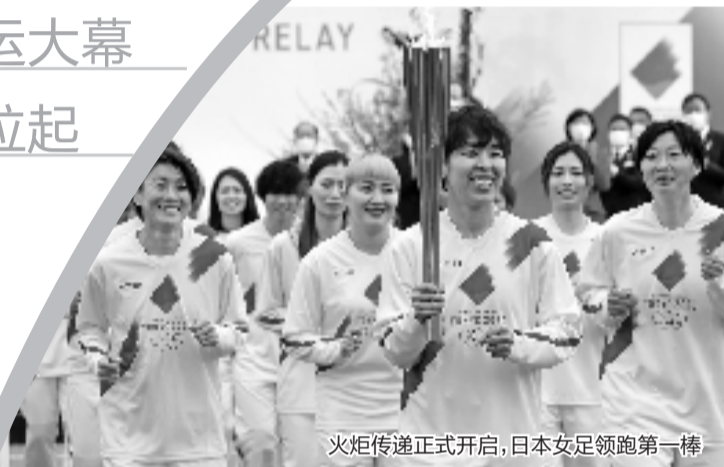
火炬传递正式开启,日本女足领跑第一棒