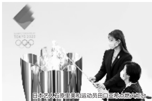
日本艺人石原里美和运动员田口亚希点燃火炬台

除了疫情,火炬手不断请辞也成为一大麻烦。火炬传递仪式日益临近,但包括演员香川照之、常盘贵子、渡边彻、广末凉子、黑木瞳,花样滑冰选手宇野昌磨等在内的火炬手相继因为各种原因请辞,甚至就在仪式的前一天,原本计划担任第一棒火炬手的前日本国家女子足球队队长泽穗希也因身体原因退出。而这背后是日本民众对于东京奥运会的举办热情愈发降低。