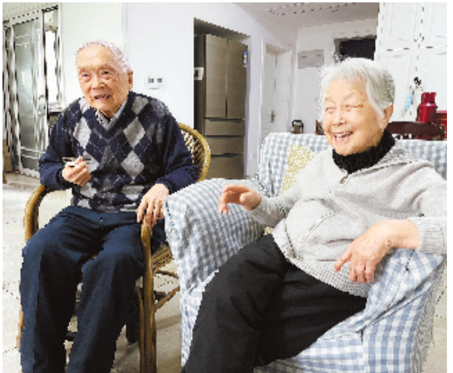
96岁的何爷爷和93岁的宋奶奶