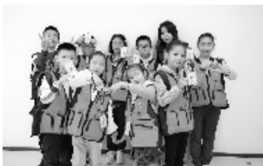
吕老师和她的学生

事情发生后,吕老师并没有第一时间联系写纸条的学生,因为她要赶着去钱塘区青少年宫给孩子们上课。