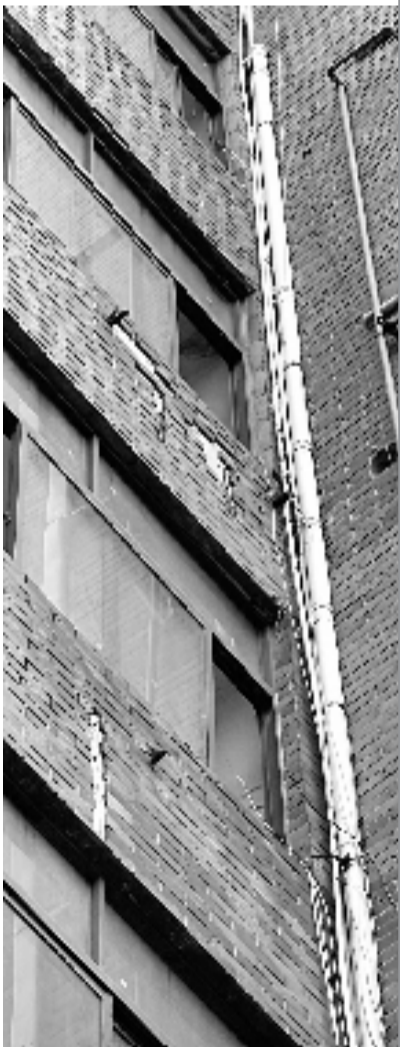
小区外墙剥落明显