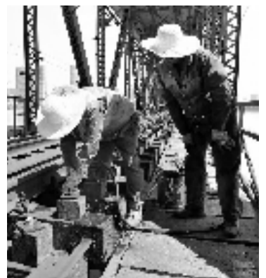
2015年,工人正在维护钱塘江大桥铁路桥面