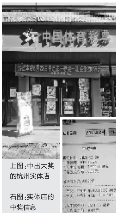
上图:中出大奖的杭州实体店