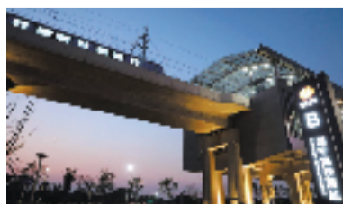
海宁高铁西站

好摄之友 #爱拍#活动 投稿途径一: 通过小时新闻 App“帮帮团” 扫二维码 下载小时新闻