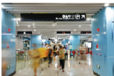
桐九公路站内景