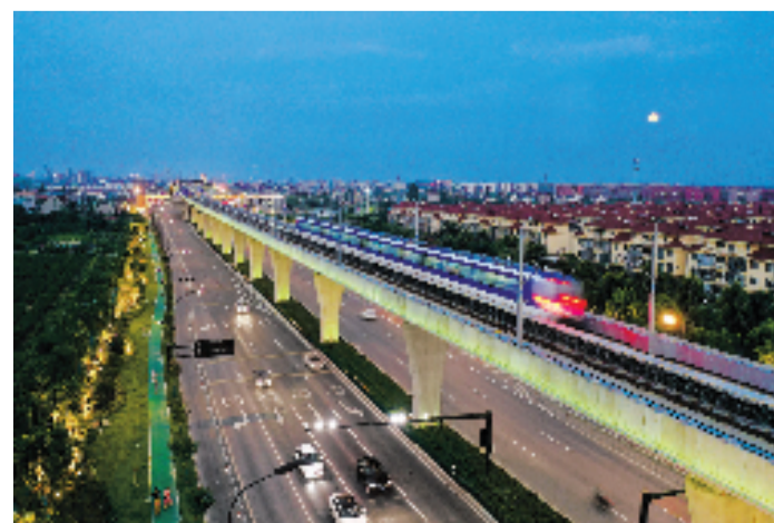
硖许公路和桐九公路交叉口西侧