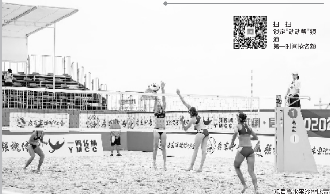
观看高水平沙排比赛