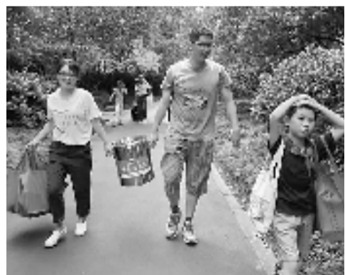
本报男记者帮忙将彭埠街道统一煮好的茶送往摊点