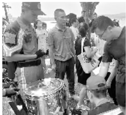
西湖断桥边的凉茶摊,消防队员为游客服务