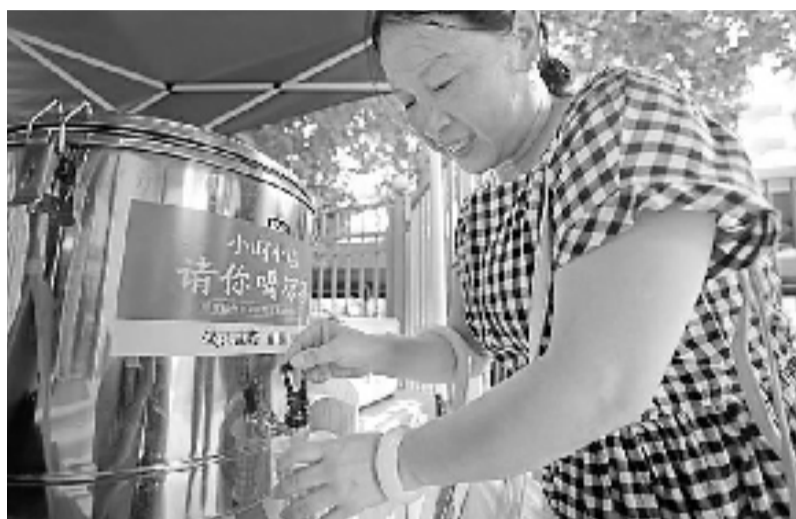
设在文晖街道疫苗接种点的凉茶摊

一个个贴有“小时小店请你喝凉茶”标识的凉茶桶,在杭城各处陆续出现,并在昨天集体亮相。