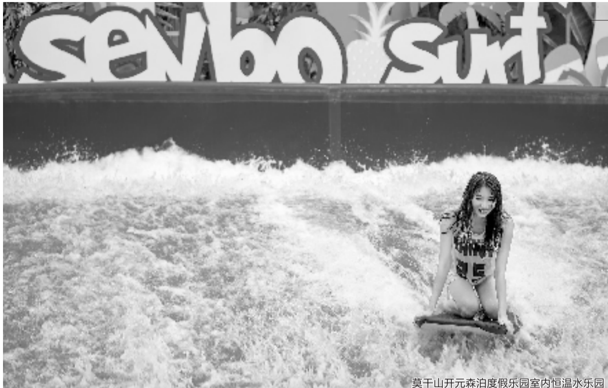
莫干山开元森泊度假乐园室内恒温水乐园