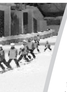
绍兴柯桥乔波冰雪世界