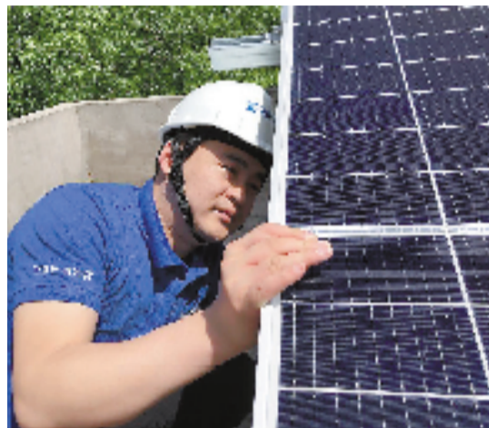
正泰安能工作人员为农户安装光伏板。

日前,国家发改委在回复一位网友提问时表示,与其他国家相比,中国居民电价偏低,工商业电价偏高。下一步要完善居民阶梯电价制度,使电力价格更好地反映供电成本,还原电力的商品属性。此消息引发外界关注。