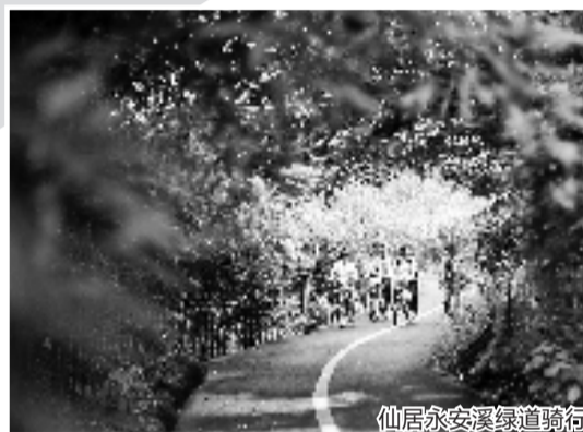
仙居永安溪绿道骑行

骑行攻略:从千岛湖大桥出发,沿千汾公路骑行,全长70多公里。沿途经过小金山营地-界首桔园-姜家风情小镇-水下古城-龙川湾景区-芹川古村落-浪川大连岭-汾口中华鳖基地等