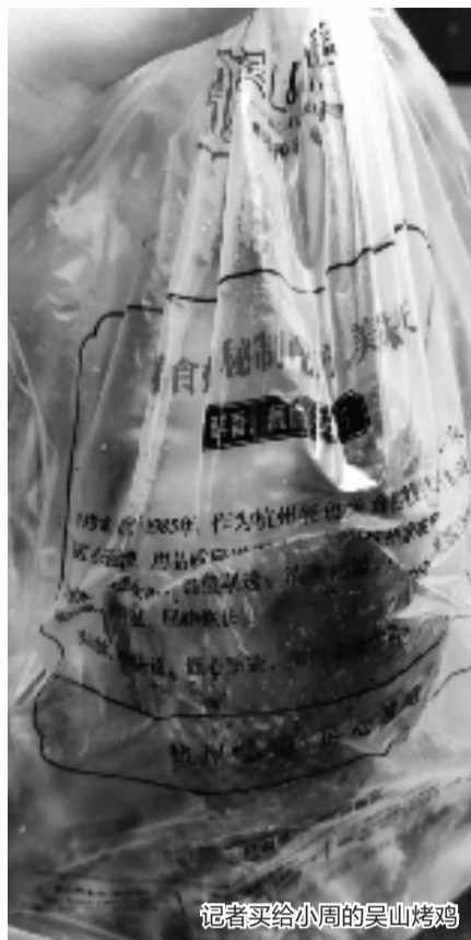
记者买给小周的吴山烤鸡