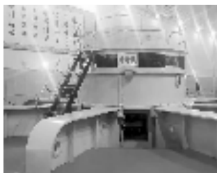
周恩来题字展示在4号机旁