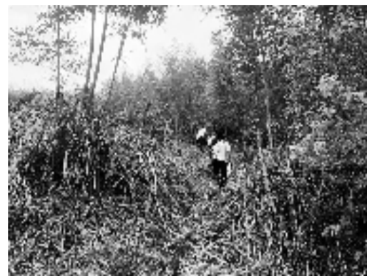
“浙江山野”的老师们和学校校长在山上探路

天天正能量的工作人员说：“期望这次的自然课堂，也能为孩子们种下一颗好奇心，重新认识自己每天都能看到的花花草草。”