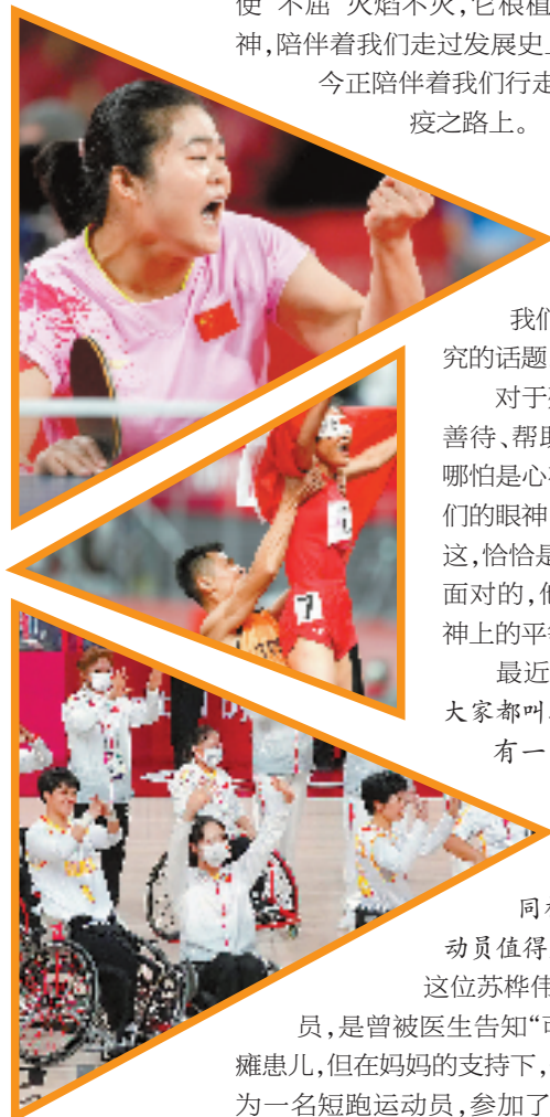
东京残奥会 比赛现场

●中共中央、国务院9月5日向第16届残奥会中国体育代表团致贺电。贺电说:你们勇于超越、奋勇争先,圆满完成参赛任务,充分展示了新时代我国残疾人运动员挑战极限、锐意进取、顽强拼搏的精神风貌,生动体现了我国残疾人运动的蓬勃发展。你们的精彩表现为广大残疾人树立了榜样,为残奥事业增了彩,为祖国争了光。