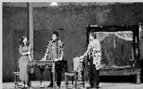
陆帕导演的《狂人日记》