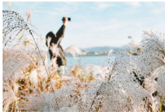
老余杭南湖公园,芦花丛中的拍照人。