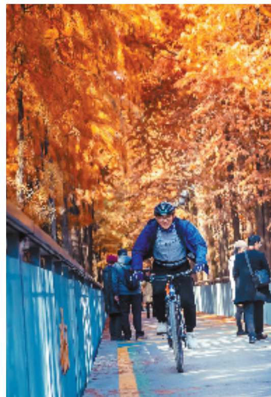
冬季是青山湖水上森林色彩最绚烂的时节。