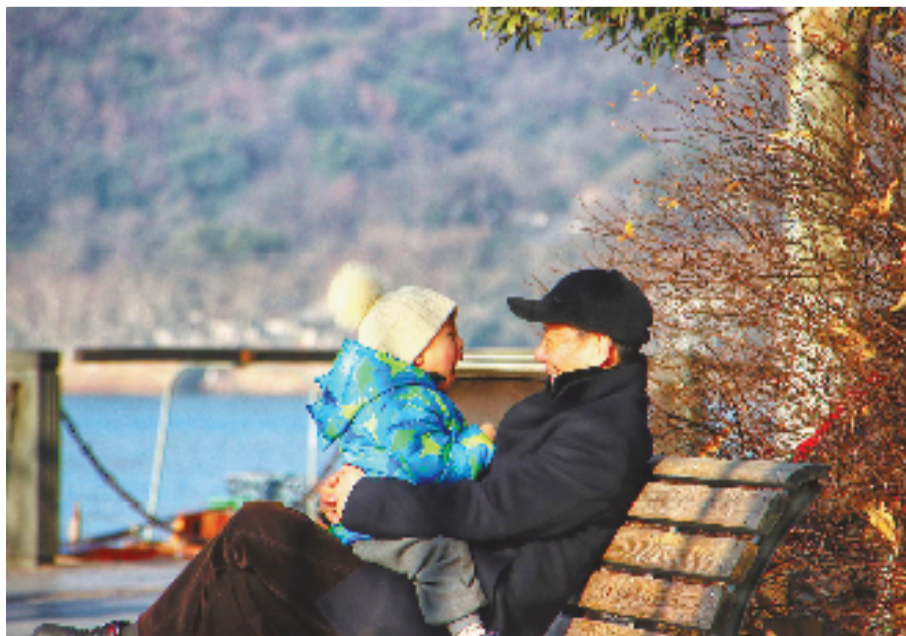
西湖边的冬日暖阳下,一老一少其乐融融。