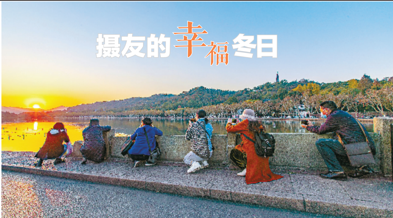
冬日断桥,抓拍美景的人。流水 2011 摄

冬天,对于摄友们来说,不算是旺季。特别是这段时间疫情防控形势严峻复杂,很多摄友都呆在家里,拍惯了花花草草、绿水青山的摄友们,除了整理塞满了图片的文件夹之外,还有什么能拍?