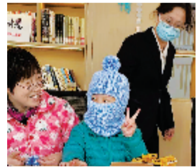
阿姨们做的样品帽子