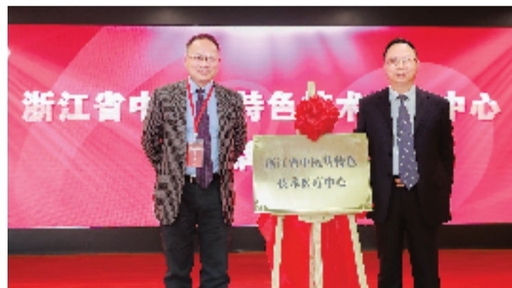
全省首家中医药特色技术医疗中心落户浙江省中山医院

浙江本轮疫情发生后,浙江省中山医院快速响应、积极部署,吹响战疫“集结号”,组织了100人的核酸采样机动队,并先后向绍兴地区派出了核酸检测医疗队和医疗专家。