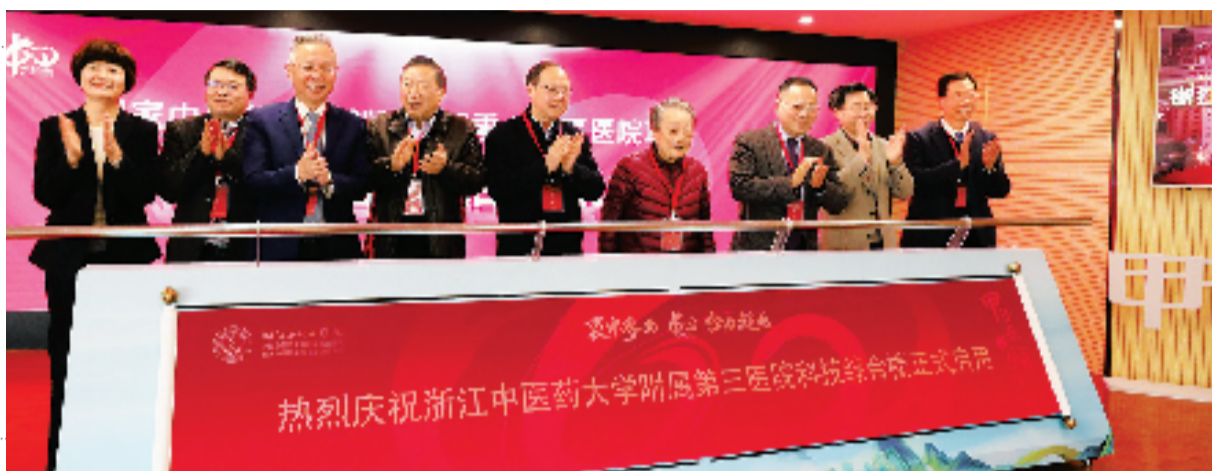
科技综合楼启用仪式现场

12月18日,正值浙江中医药大学附属第三医院(浙江省中山医院)建院60周年,中医药传承创新大会暨第六届中山国医论坛在杭州举行,院士大咖和众多中医药专家学者相聚云端,深入探讨新冠疫情疫情防控新形势下,如何发挥中医药抗疫独特优势,推动中西医结合特色抗疫,促进中医药传承创新发展。