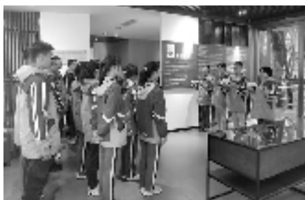
青苗班学员宣读《赤子宣言》