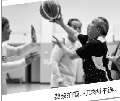
费叔拍摄、打球两不误。