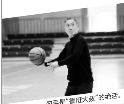
勾手是“鲁班大叔”的绝活。