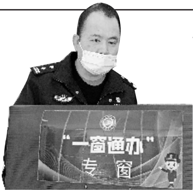
民警阿目在工作中