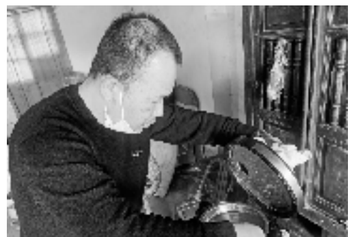
阿目正在为村里老人做饭