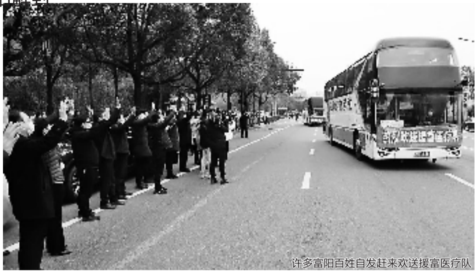
许多富阳百姓自发赶来欢送援富医疗队