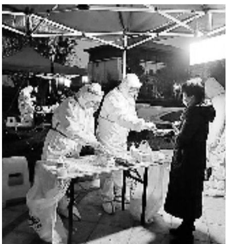
抗疫一线的场面是这段视频主要内容

免耽误支援工作,除夕这天他一个人在城区度过。原本科室备班是轮换的,作为科室的“老大哥”,考虑到两个原因,他一直坚持一人奋战。“我的想法很简单,就是做一些自己力所能及的事,去帮助那些需要帮助的人。”