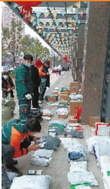
工作人员正在分拣邮件

据统计,从1月27日到2月10日,杭州邮政公司滨江区分公司总共有6000件左右的积压快件。“这6000件积压邮件,消化起来并不难,我们日均邮件进口量就有近3万件,只要情况恢复正常,很快就可