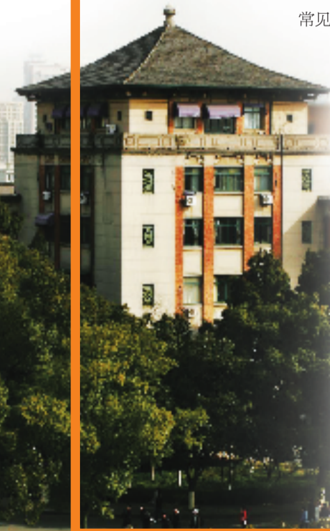
浙江大学玉泉校区教三